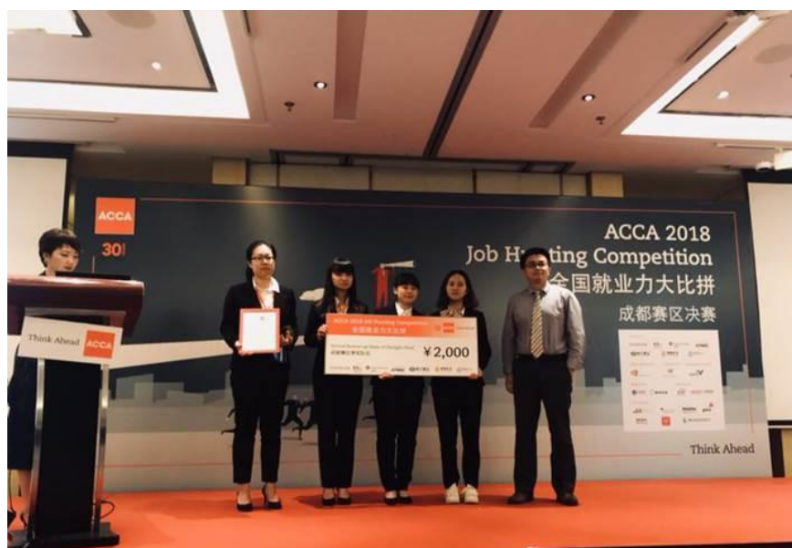
( 2016 级 ACCA 教改班代表队获西南赛区季军 )

咨询地址： 重庆市沙坪坝区壮志路 33 号四川外国语大学东区（山下）文英楼 2-1 办公室