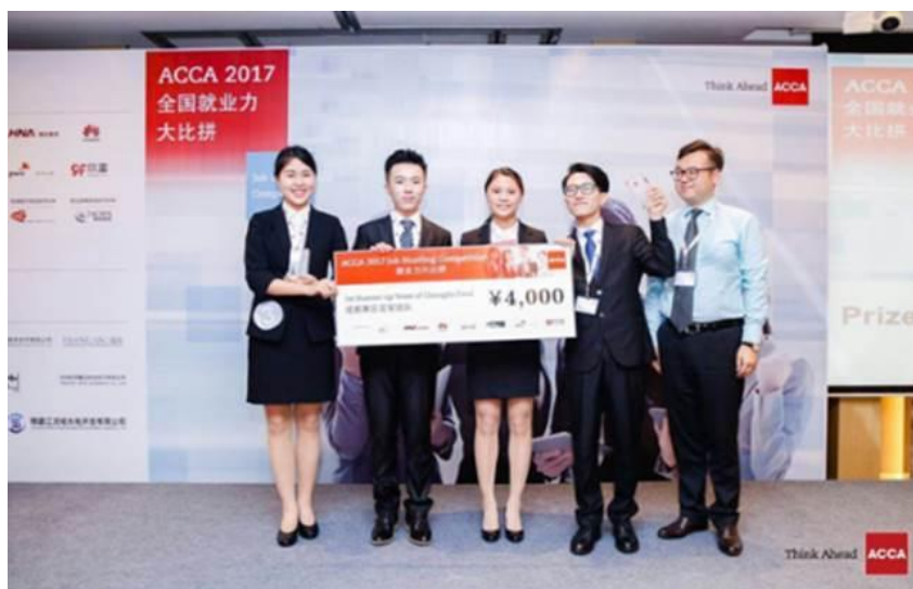
( 2014 级 Pallas 团队成员参加 ACCA2017 年全国就业力大比拼喜获西南赛区亚军，入围全国总决赛 )