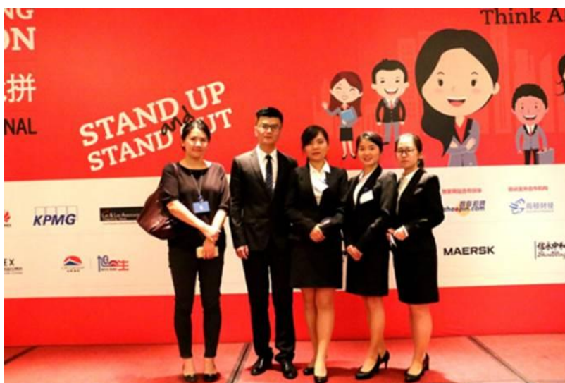
( 2013 级 ACCA 教改班 spark 团队获得 2015 年 ACCAJHC 西南赛区优胜奖 )