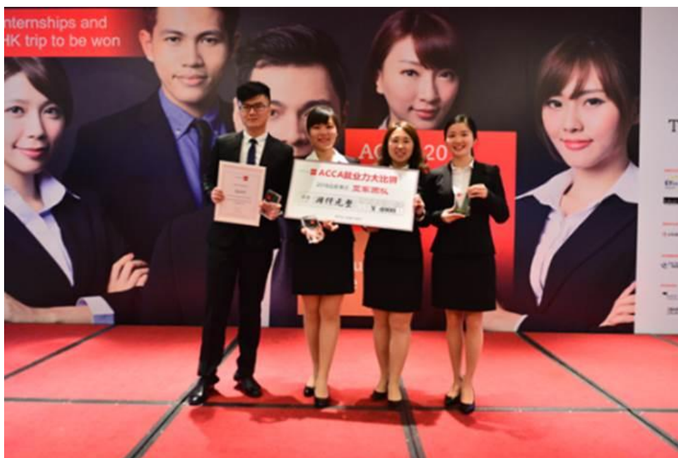
( 2013 级 ACCA 教改班 spark 团队获得 2016 年 ACCAJHC 西南赛区亚军，挺进全国总决赛 )