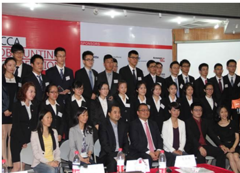
( 2011 级 ACCA 全球就业大比拼参赛队与世界五百强评委及其它参赛队合影 )